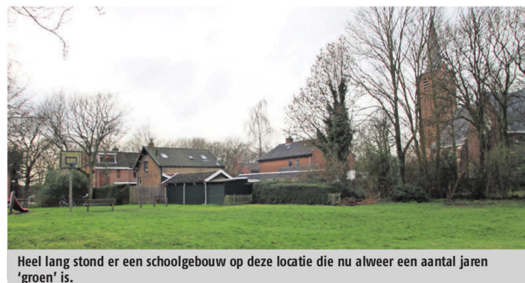
Heel lang stond er een schoolgebouw op deze locatie die nu alweer een aantal jaren 'groen' is.

stond, is het toestaan van nog groter bebouwing op die plek onbespreekbaar."