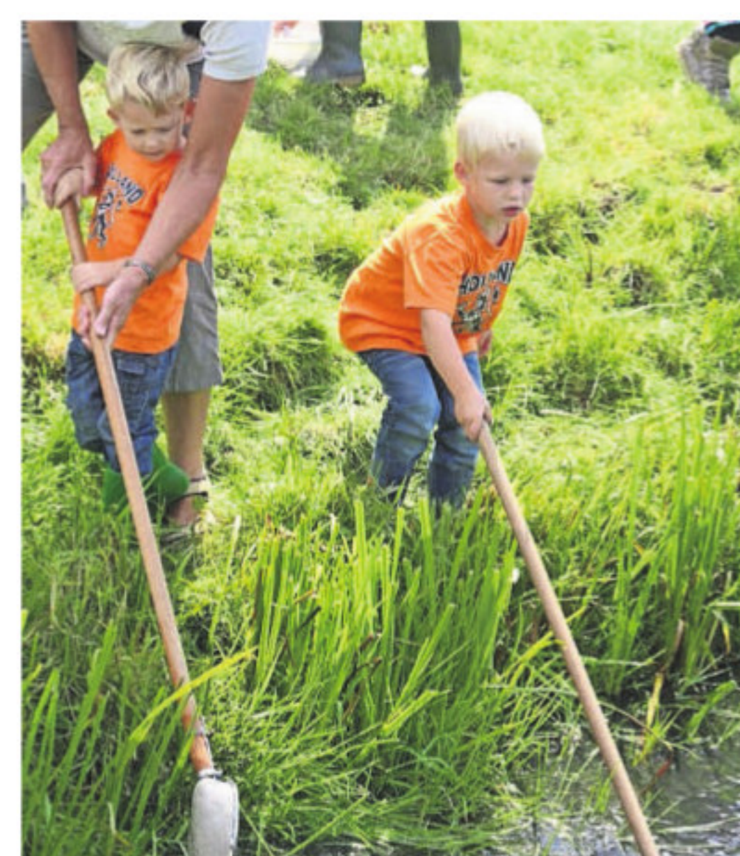
Van alles te doen en te beleven tijdens de Biesland Dagen.