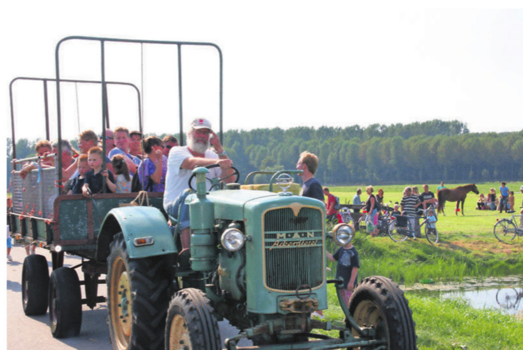
Toepasselijk 'openbaar vervoer'.

Plaats: Polder van Biesland, Noordeindseweg en Bieslandseweg. Wanneer: zaterdag 3 september 2016 van 12.00 tot 17.00 uur en zondag 4 september 2016 van 10.00 en 17.00 uur.